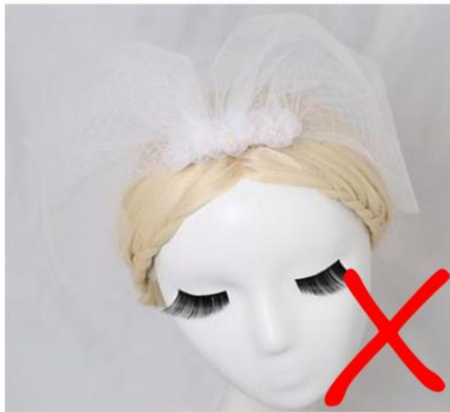
背景与主体物难以区分