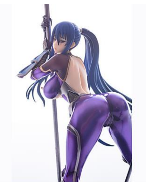
过于性感的玩具摆件类