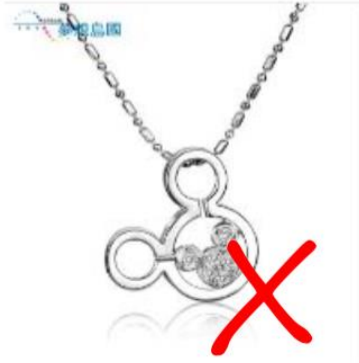
侵权产品（著名卡通形象，人民币，知名肖像等）

关于侵权：采购提供的图片严禁带有侵权LOGO或为侵权产品，或产品自身带其他网站网址。使用非自主拍摄的图片做产品图的，须有版权方授权，严禁使用具有版权纠纷的图片。