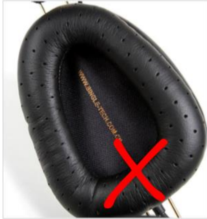
产品上带其它网站网址